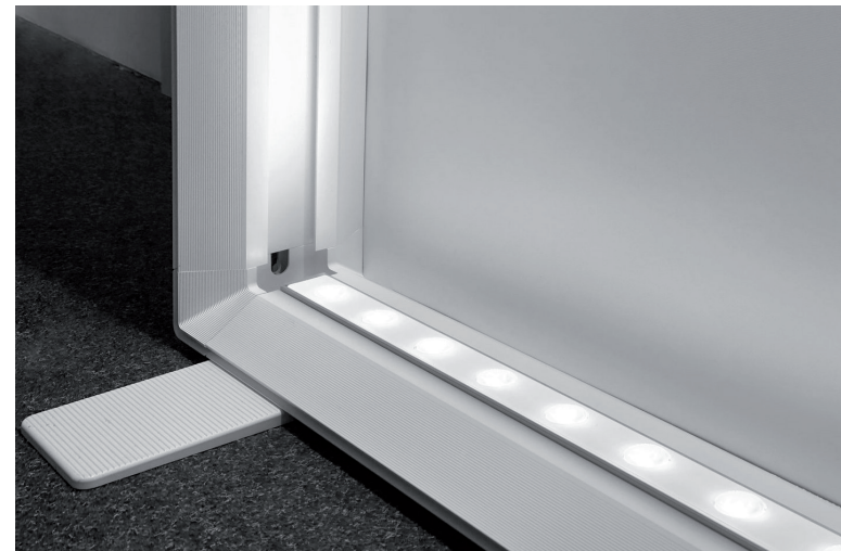
Des panneaux rétro-éclairés en aluminium & Leds à basse consommation Et des impressions réutilisables ou recyclables : transformation en Tote bag