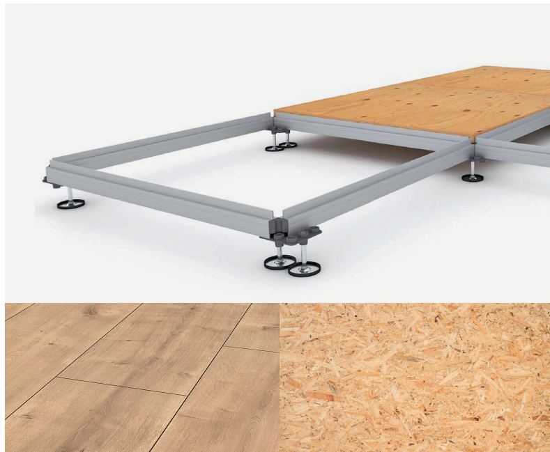
Un plancher avec des matériaux réutilisables

Le choix de nos partenaires, fournisseurs et sous-traitants se fait sur base de critères qualités et écologiques . Nous favorisons des fournisseurs et sous-traitants locaux ou appartenant à la Grande Région (Belgique, France et Allemagne) pour réduire les distances de transports et donc les émissions de gaz à effet de serre. Depuis la création de l'entreprise, FAIRFAIR a toujours investit dans du matériel de qualité , certes plus cher car local et durable mais cela nous permet d'avoir du matériel qui dure dans le temps. Lorsque nous investissons dans du matériel, l'achat de celui-ci est réfléchi pour servir à plusieurs clients et projets. Les produits doivent également permettre une limitation des déchets et favoriser leur recyclage .